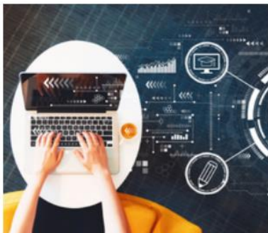
Edukacja i podnoszenie kompetencji na rynku pracy