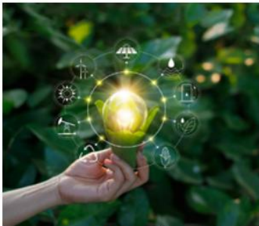
Dostosowanie do zmian klimatu