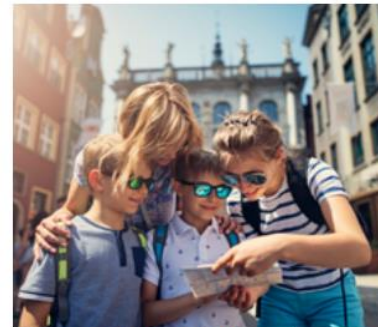
Kultura i turystyka