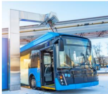
Transport i mobilność