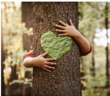
Zachowanie i ochrona środowiska